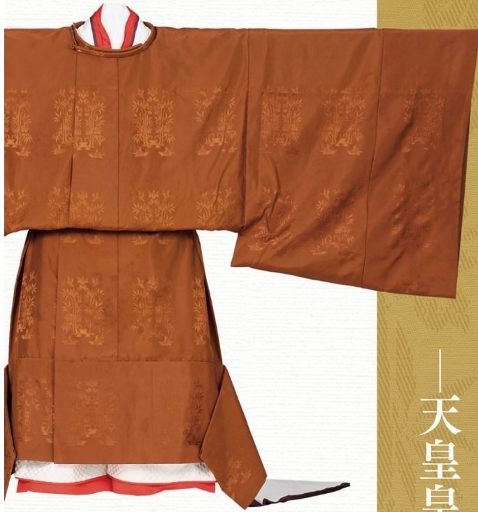
天皇家下ご装束 御成婚 黄龍染御袍（前期展示）