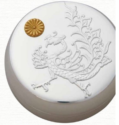
ボンゴニール 御即位記念（全期間展示）

Special Exhibition Celebrating the 5th Year of His Majesty's Reign and the 30th Wedding Anniversary of Their Majesties Ushering in the Reiwa Era: 30 Years in Retrospect