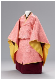
左: 広報画像 R-6