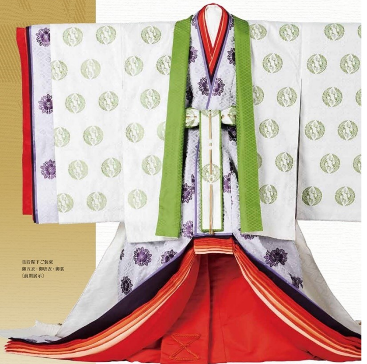
皇陛下下ご装束 第五衣・御成婚衣・御裳（前期展示）