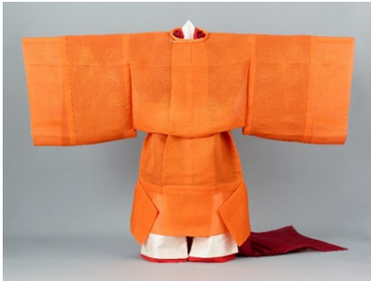
広報画像 R-4 「結婚の儀」天皇陛下