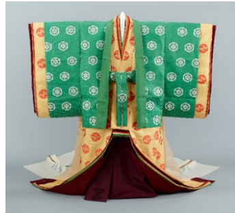
広報画像 R-5 「結婚の儀」皇后陛下